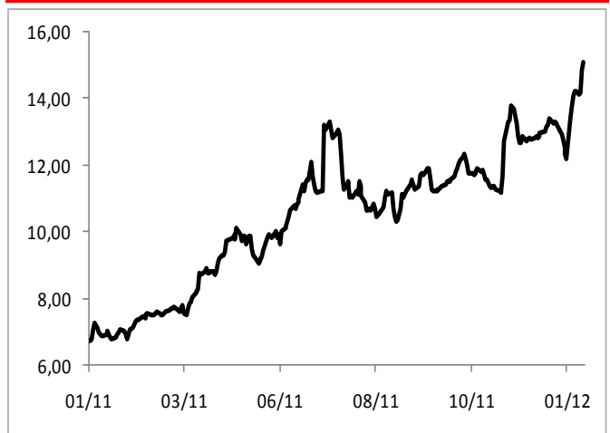
Grafik 2: Portekiz 10 Yıllık Devlet Tahvili Faizi (%)